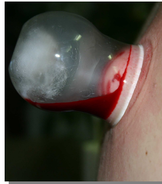
Abb. oben: Blutiges Schröpfen mit Glas Abb. links: Blutegelbehandlung

Dieser Kurs ist für Berufsanfänger ebenso geeignet wie für Kollegen, die Ihr Repertoire in Ihrer Praxis um diese sehr wirksame Heilmethode bereichern wollen. Wie bei den Kursen der GDT Heilpraktikerschule üblich, werden Sie in diese besonderen Behandlungsformen mit kurzer Theorie eingewiesen und eingehend in der praktischen Anwendung mit vielen gegenseitigen Übungen angeleitet. Sie werden viele nützliche Tipps und Hinweise erhalten, wie Sie Fehler vermeiden und Behandlungen mit diesen Methoden sinnvoll und erfolgreich durchführen können.